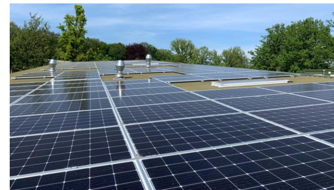
Aeres MBO, Barneveld