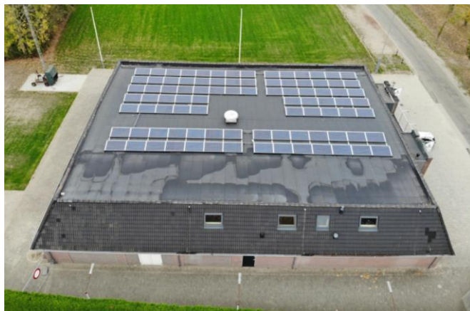
Schutterij EMM, Zevenaar