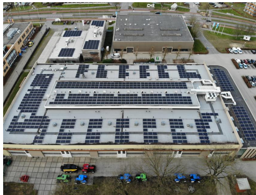
Aeres Tech, Ede