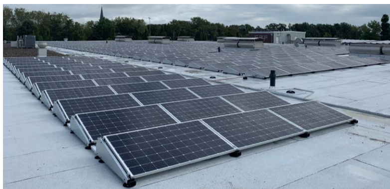
Kinkelder metal solutions, Zevenaar